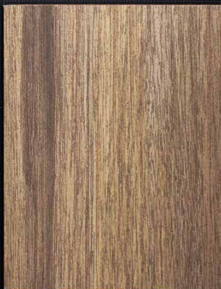
◆ A04 山胡桃