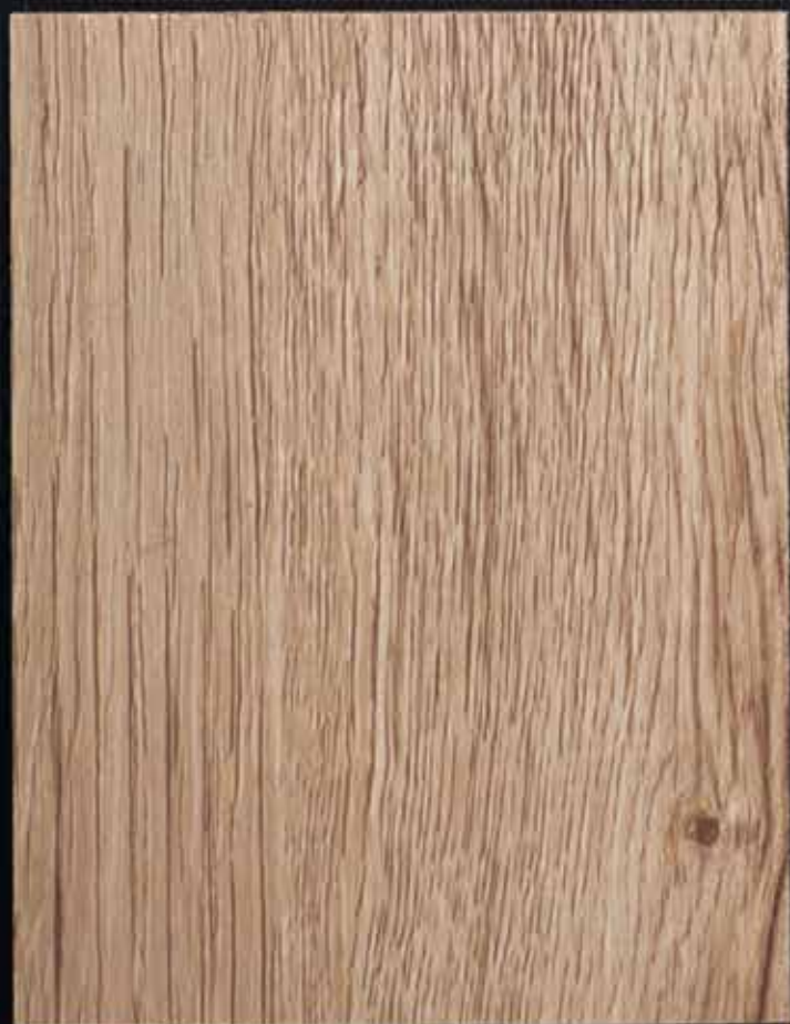
◆ A03 摩卡榆木