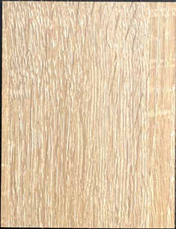
◆ A05 貴族梧桐