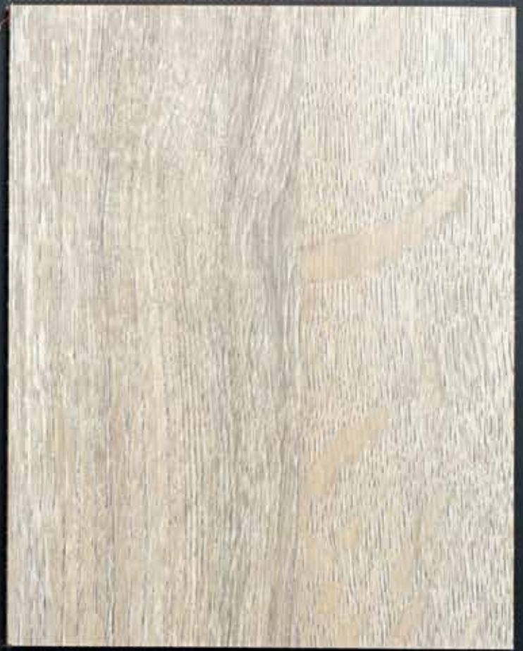
◆ A63 南非象牙木