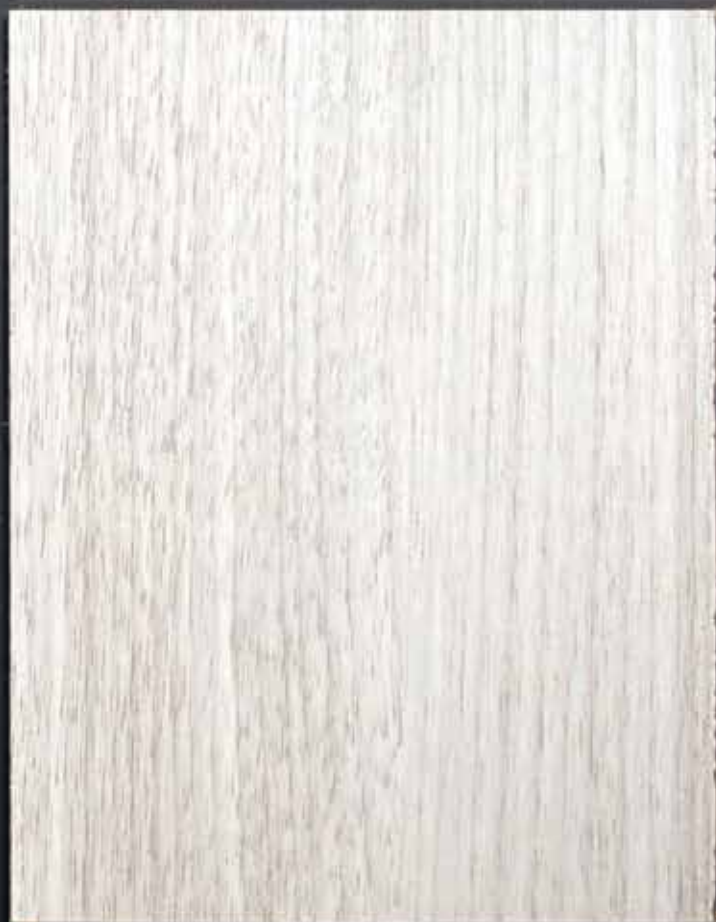
◆ A02 瑞士白橡