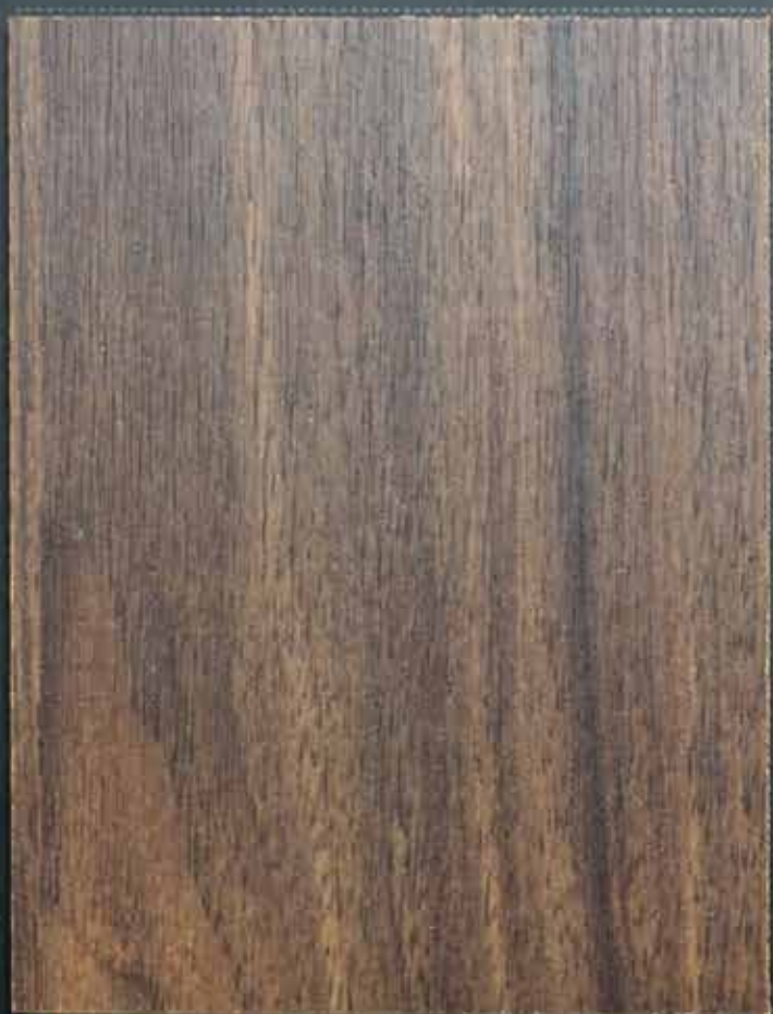
◆ A09 香榭胡桃