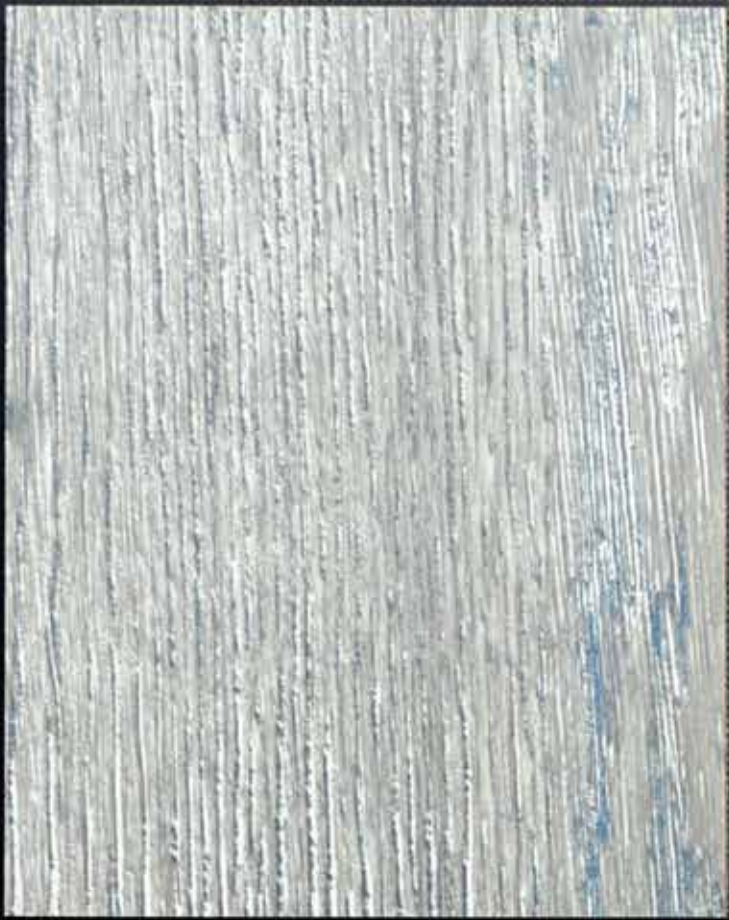
◆ A62 莱茵秋色