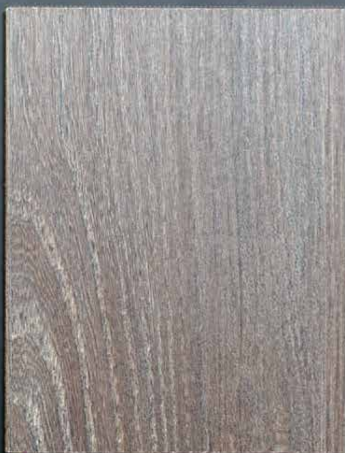
◆ A10 菩提木