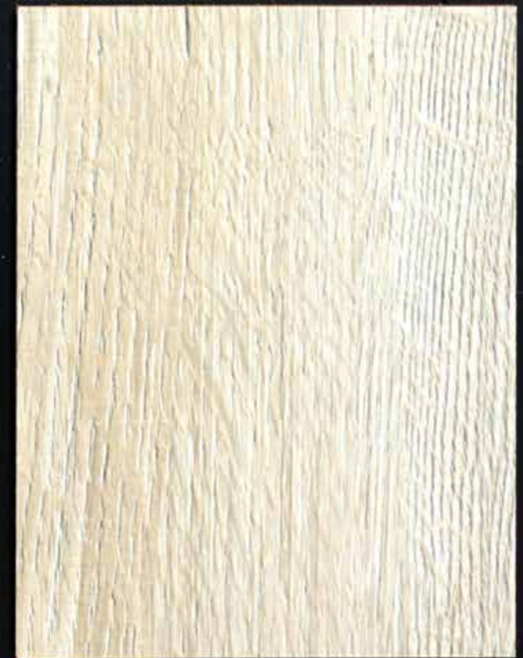
◆ A08 冰島月光