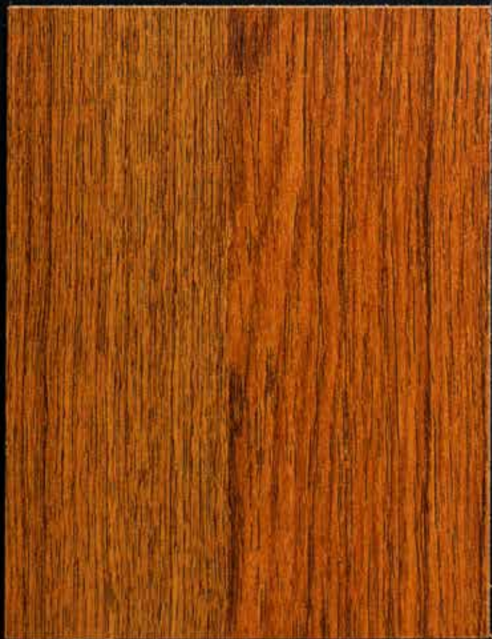
◆ A07 泰國柚木