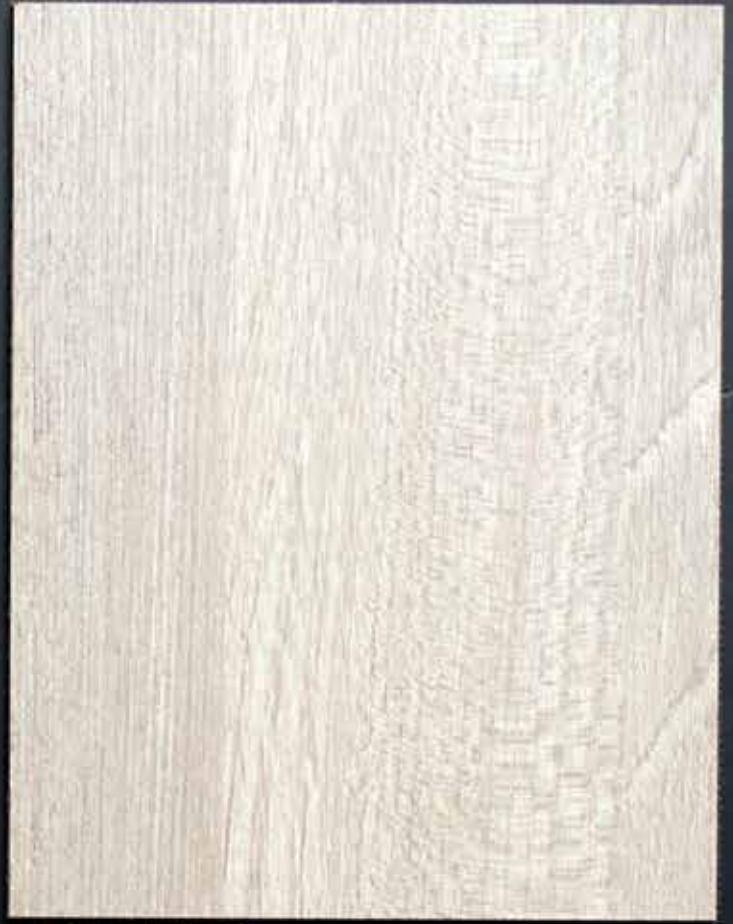
◆ A06 南美玉檀