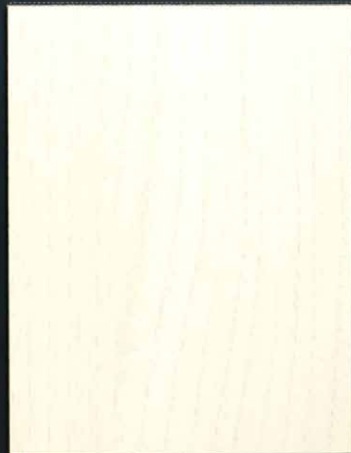
◆ A61 琥珀桂木