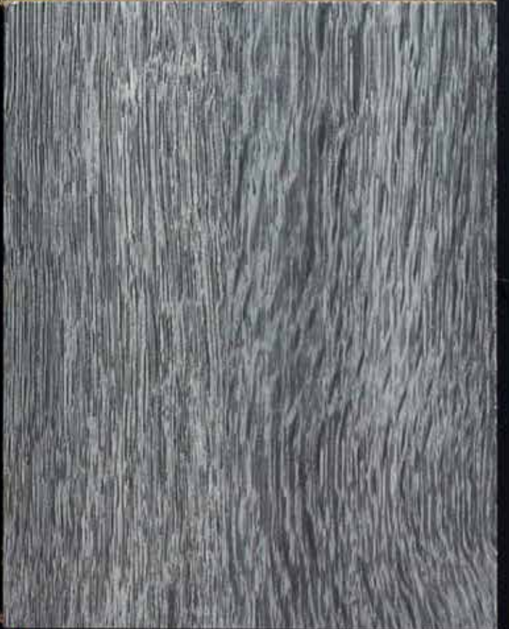
◆ A65 灰白胡桃