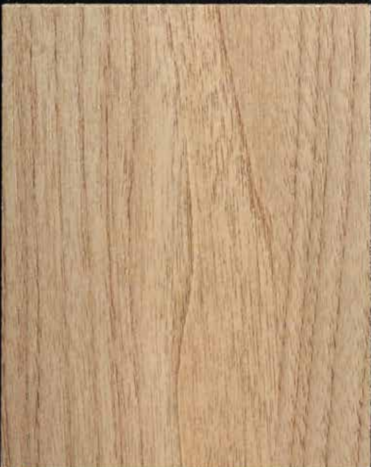
◆ A64 北美原橡